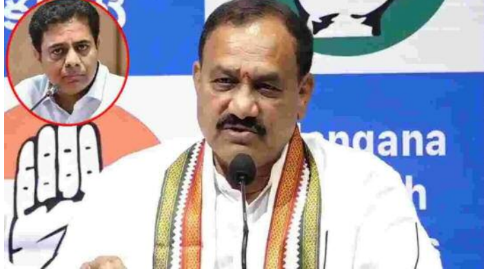
శాసనసభ / హైదరాబాద్ : మాజీ మంత్రి కేటీఆర్ పై ఈ ఫార్ములా కేసు సక్రమమే అని టిపిసీసీ అధ్యక్షులు మహేష్ కుమార్ గౌడ్ అన్నారు. శుక్రవారం మండలి మీడియా సాయింట్ వద్ద మాట్లాడుతూ.. ఫార్ములా ఈ కారు రేసులో అక్రమాలు జరిగిన మాట వాస్తవమన్నారు. అక్రమాలు జరిగినట్లు పలు ఆధారాలున్నా.. కడిగిన ముత్యమంటూ కేటీఆర్ తనకు తానే సర్టిఫికేట్ ఇచ్చుకోవడం హాస్యాస్పదమన్నారు. ప్రభుత్వం పంపిన ఆధారాలపై గవర్నర్ న్యాయనలహా తీసుకొని కేసుకు అనుమతించాక ఇది అక్రమ కేసు ఎలా అవుతుందని ప్రశ్నించారు.