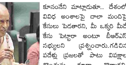
రేవంత్ రెడ్డిని కూడా 5 నిమిషాల కంటే ఎక్కువ సభలో మాట్లాడనివ్వలేదన్నారు. ఇప్పుడూ మీరు చెప్పిందే జరగాలంటే ఎలా అంటూ కుాననేని బీఆర్ఎస్ ఎమ్మెల్యేలను నిలదీశారు. సభలో బీఆర్ఎస్ సభ్యులు నిరసన చేస్తుండగా వారి చేతికి అందిన కాగితాన్ని అందినట్లు చించివేస్తున్నారని కుాననేని అన్నారు.