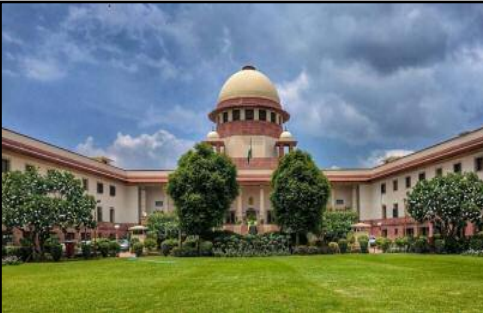
పరిగణించబడతారన్నారు. అంతేవల్ల వివాహ వ్యవస్థ "వాణిజ్య వెంచర్" కాదని న్యాయమూర్తులు పేర్కొన్నారు. మహిళలు తమ చేతుల్లో ఉన్న చట్టాలను సంక్షేమానికి ఉపయోగించుకోవాలి కానీ.. భర్తలను శిక్షించడం కోసమా.. బెదిరించడం కోసమా.. లేదంటే ఆదిపత్యం చెలాయించడం కోసమా కాదని బెంచ్ పేర్కొంది. పోలీసు అధికారులు కూడా కొన్నిసార్లు నెలెక్టివ్ కేసుల్లో త్వరగా చర్య తీసుకుంటారని.. భర్త లేదా అతని బంధువులను కూడా అరెస్టు చేస్తున్నారని బెంచ్ ధ్వజమెత్తించింది. సంపదను సమయం చేయడానికి భరణం ఒక మార్గం కాదని సర్వోన్నత న్యాయస్థానం పేర్కొంది. సమమైన భరణం కోరడంపై ధర్యాసనం తీవ్ర అభ్యంతరం వ్యక్తం చేసింది. చాలా మంది ఈ విధంగానే కోరుతున్నారు.. ఇలాంటి కేసుల్లో ఎక్కువ అవుతున్నాయని తెలిపింది. ఒక వేళ భర్త పేదవాడిగా మారితే.. భార్య సంపదను సమం చేయడానికి ఇష్టపడుతుందా? అని బెంచ్ ఆశ్చర్యం వ్యక్తం చేసింది.