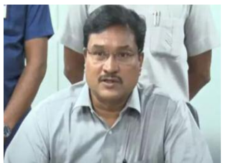
అంశంపై నిర్వహించిన జాతీయ సదస్సుకు ముఖ్య అతిథిగా హాజరై ప్రసంగించారు.