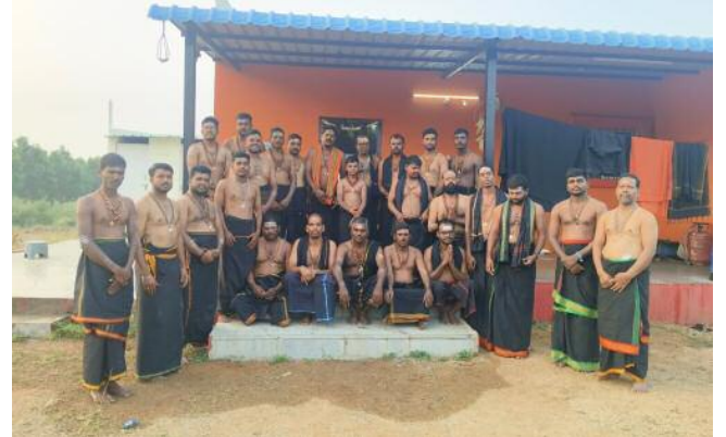
చింతపల్లి అయ్యప్ప సన్నిధానంలో అయ్యప్ప స్వాములు

శాసనసభ న్యూస్ స్టేట్ నెట్వర్క్ ఇంచార్జ్. పి. వెంకటేష్ (నవంబర్ 16) స్వామియే.. శరణమయ్యప్ప... అనే శరణుఘోష వినిపించే రోజులివి. అయ్యప్ప నామంతో భక్తకోటి పులకించే సమయమిది.. కఠోర దీక్షలో నియమావళిని ఆచరిస్తూ స్వామి సేవలో తరించే కాలమిది.. అయ్యప్ప దీక్షలు చేపట్టేందుకు భక్తులు సిద్ధమవుతున్నారు. ఇప్పటికే చింతపల్లి మండలంలో ఎంతోమందికి అయ్యప్ప మాలలు ధరించి గురుస్వామి సూచన మేరకు పూజల్లో మునిగి తేలుతున్నారు. ఏటా మాలధారుల సంఖ్య పెరుగుతున్నదని గురు స్వామి చెనమోని రాములు తెలిపారు.