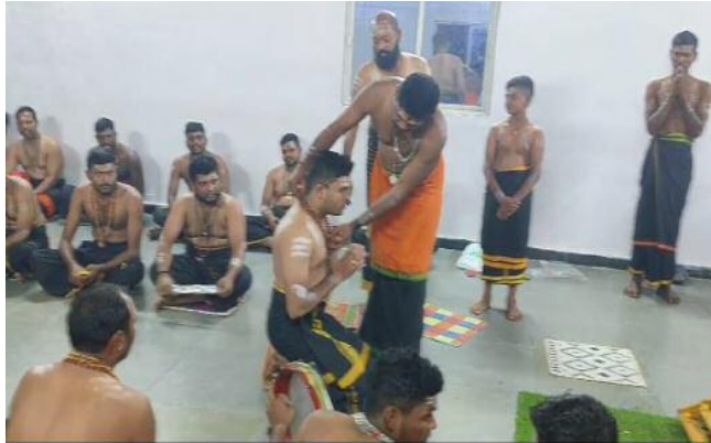
కన్నె స్వాములకు మాలవేసి దీక్ష ఇస్తున్న రాములు గురు స్వామి