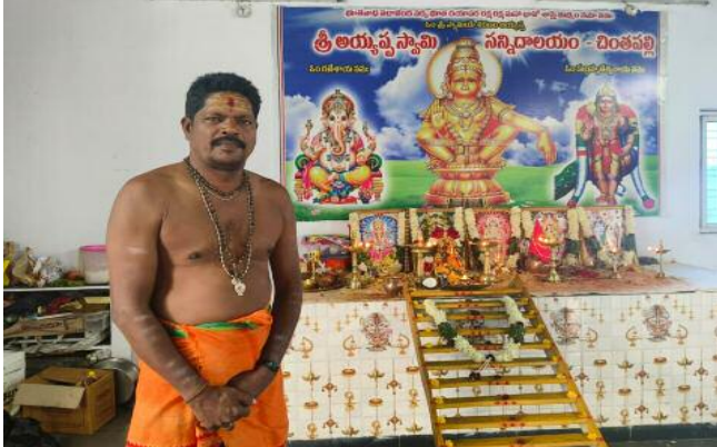
అయ్యప్ప గురు స్వామి చెనమోని రాములు