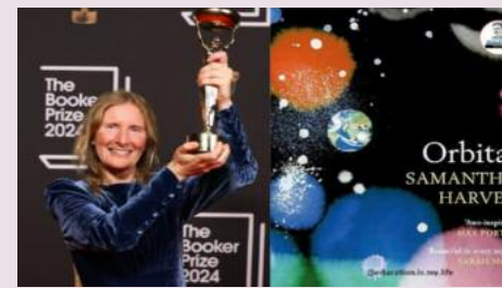
నేపథ్య రచనగా “ఆర్బిటల్” నిలిచింది.

చందూర్ నవంబర్ 16 (శాసనసభ స్యూస్) : బ్రిటన్ రచయిత్రి సమంతా హార్వే రాసిన “ఆర్బిటల్” నవల 2024 ఏడాదికిగాను బుకర్ ప్రైజ్ విజేతగా ఎంపికైంది. పై నుంచి భూమి పై 16 సూర్యోదయాలు, సూర్యాస్తమయాలను చూసిన అంతర్కాశీయ అంతరిక్ష కేంద్రంలోని ఆరుగురు వ్యోమగాముల జీవితాల్లో ఒక రోజుంతా జరిగే పరిణామాలను నవలలో ఈమె వివరించారు. ఈ అవార్డు సాధించిన తొలి అంతరిక్ష