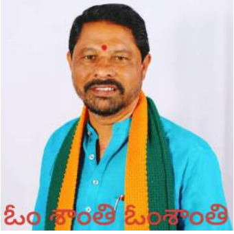
ఓం శాంతి ఓం శాంతి