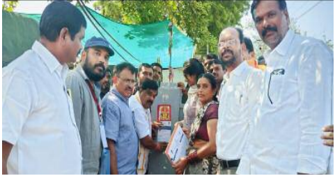
కొండమల్లేపల్లి శాసనసభ స్పూస్ నవంబర్ 7 :

కొండమల్లేపల్లి మండల పరిధిలోని పెండ్లిపాకుల చెరువు వద్ద మత్స్యకారుల ఆర్థిక అభివృద్ధి లక్ష్యంగా జిల్లా మత్స్యశాఖ అధికారులు, ప్రజా ప్రతినిధులు, నాయకులతో కలిసి ఉచిత చేప పిల్లల పంపిణీ కార్యక్రమానికి ముఖ్య అతిథిగా హాజరై, చేప పిల్లలను పంపిణీ చేసిన దేవరకొండ ఎమ్మెల్యే నేనావత్ బాలునాయక్. అనంతరం ఎమ్మెల్యే ను మత్స్యశాఖ అధికారులు, సొసైటీ డైరెక్టర్లు శాలువాతో సత్కరించారు. ఈ సందర్భంగా ఎమ్మెల్యే మాట్లాడుతూ మత్స్యకారులను ఆర్థికంగా బలోపేతం చేసేందుకు చేప పిల్లల పెంపకం పై ప్రభుత్వం దృష్టి సారించినట్లు ఎమ్మెల్యే అన్నారు. నియోజకవర్గంలోని అన్ని మండలాల్లో చేప పిల్లలు పంపిణీ చేయడానికి ప్రభుత్వం సిద్ధంగా ఉందని, చేపల ఉత్పత్తి గణనీయంగా పెంచడమే లక్ష్యంగా ప్రభుత్వం పని చేస్తుందని సూచించారు. రాష్ట్రంలో ఆర్థిక సంక్షోభం ఉన్నప్పటికీ, అందరికీ సంక్షేమ పథకాలు అందించడమే ప్రజా ప్రభుత్వ లక్ష్యమని తెలిపారు. రాష్ట్రంలో బడుగు బలహీన వర్గాల అభివృద్ధికి ముఖ్యమంత్రి రేవంత్ రెడ్డి కృషి చేస్తున్నారని, పేద ప్రజల సంక్షేమానికి కాంగ్రెస్ ప్రభుత్వం కట్టుబడి ఉందని, ఒకవైపు అభివృద్ధి మరోవైపు సంక్షేమంతో రాష్ట్రం ప్రగతి పథంలో దూసుకు పోతుందన్నారు. భారీ వర్షాల కారణంగా చేప పిల్లల పంపిణీ కార్యక్రమం ఆలస్యం అయ్యిందన్నారు. ఆలస్యం అయిన కూడా చేపలు పెరిగి మత్స్యకారులకు ఉ