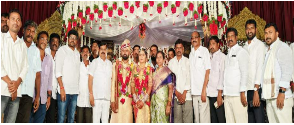
దేవరకొండ శాసనసభ స్పూస్ ప్రతినిధి నవంబర్ 7 :