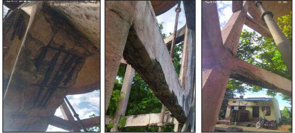
సంస్థాన్ నారాయణపురం, అక్టోబర్ 19 శాసనసభ స్యూస్ :

సంస్థాన్ నారాయణపురం మండలం వావిళ్ళపల్లి గ్రామంలో పీర్లకొట్టం ముందున్న నీళ్ల ట్యాంక్ శిథిలావస్థకు చేరుకుని సిమెంట్ పెచ్చులు ఊడి పడడంతో ట్యాంక్ చుట్టుపక్కల నివసిస్తున్న ఇండ్ల ప్రజలు ఎప్పుడు కూలుతుందోనని భయభ్రాంతులకు గురవుతున్నారు. ఊరికి నిత్యం నీటిని సరఫరా చేసే ట్యాంక్ ఇప్పుడు శిథిలావస్థకు చేరుకుంది. అప్పుడప్పుడో 1981 లో నిర్మించిన ఈ వాటర్ ట్యాంక్ కాస్త ఇప్పుడు చివరి దశకి చేరుకుని అప్పుడప్పుడు పెచ్చులు ఊడి పడడంతో పెద్ద పెద్ద శబ్దాలు వస్తున్నాయి. పొద్దంత కాయ కష్టంచేసి ఇంటికొచ్చి నిద్రపోతే గట్టిగా వస్తున్న శబ్దాలకు ఇరుగుపొరుగు ప్రజలు భయభ్రాంతులకు గురై