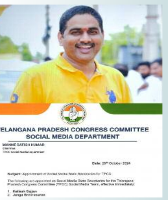
TELANGANA PRADESH CONGRESS COMMITTEE SOCIAL MEDIA DEPARTMENT

తెలంగాణ లో కాంగ్రెస్ పార్టీ మారిత పుంజుకునే క్రమం లో పార్టీ సోషల్ మీడియా ని మారితగా యాక్టివ్ చేయడనికి ప్రధానమైన సోషల్ మీడియా విభాగం లో అత్యంత ముఖ్యమైన సెక్టరల్ అను కరోజు కాంగ్రెస్ పార్టీ ప్రకటించింది.