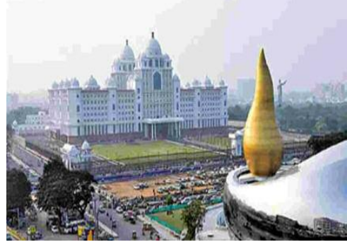
అసెంబ్లీ సీట్లు 153కు పెరిగితే ఇందులో 50 సీట్లు దాకా మహిళల కోటాకింద వచ్చే అవకాశాలున్నాయి

దేశవ్యాప్తంగా జనగణనను 2025 మొదట్లో ప్రారంభించి, 2026లో పూర్తిచేసి జనాభా ప్రాతిపదికన నియోజకవర్గాల పునర్విభజన చేపట్టనున్నారు.