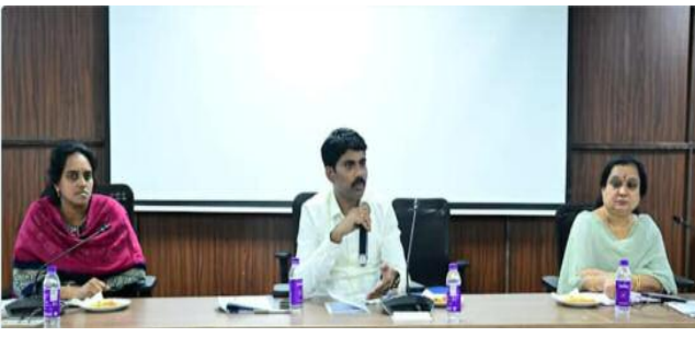
- జిల్లా కలెక్టర్ సి. నారాయణ రెడ్డి.