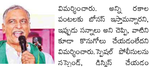
విమర్శించారు. అన్ని రకాల పంటలకు బోనస్ ఇస్తామన్నారు, ఇప్పుడు సన్నాలు అని చెప్పి, వాటిని కూడా కొనుగోలు చేయడంలేదని విమర్శించారు.