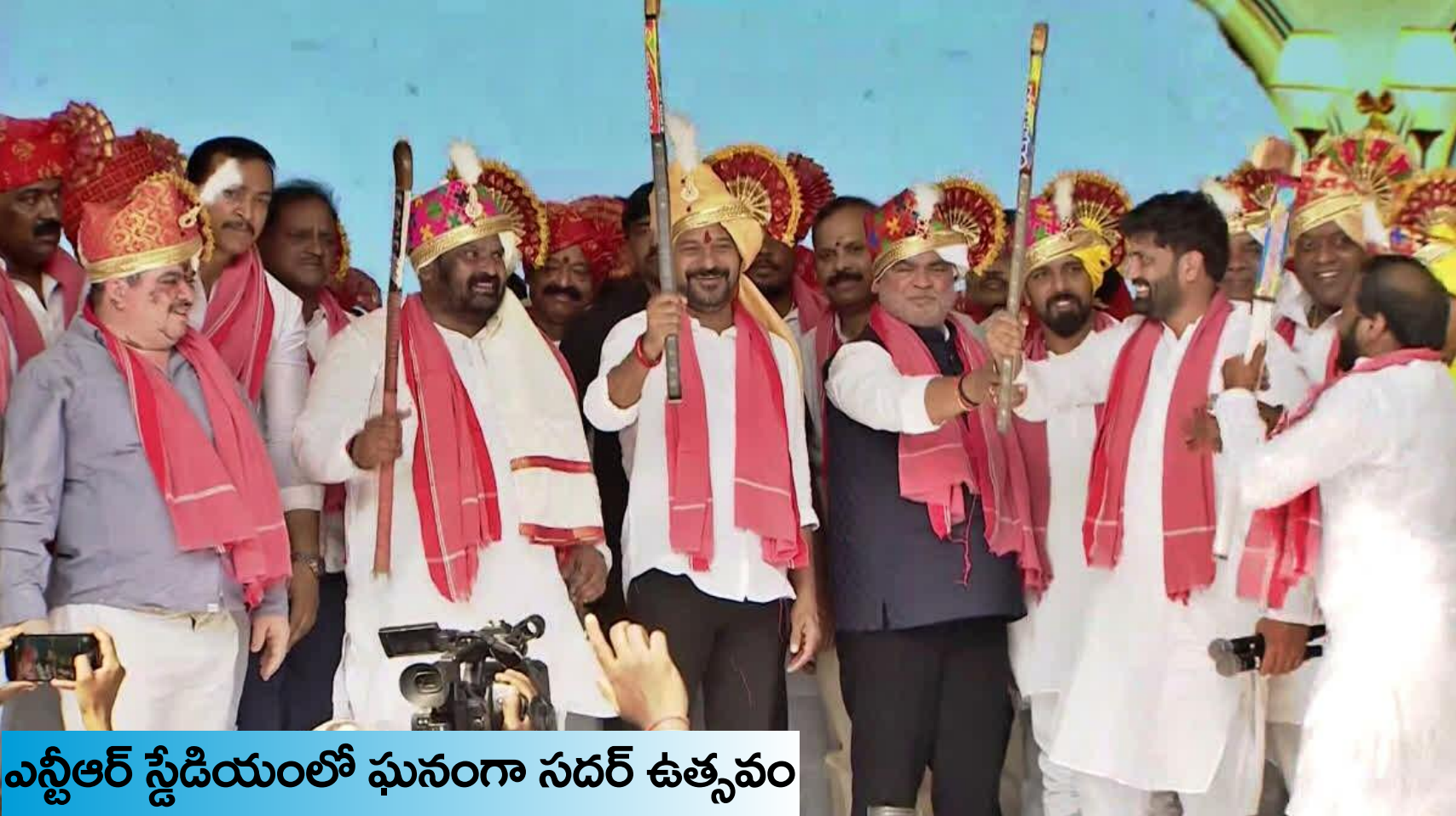
ఎన్టీఆర్ స్టేడియంలో ఘనంగా సదర్ ఉత్సవం