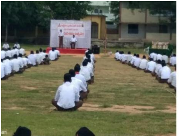
జాతీయవాద స్వచ్ఛంద సంస్థ అవతరించినది పేర్కొన్నారు. ఈ కార్యక్రమంలో స్వయం సేవకులు పాల్గొన్నారు.