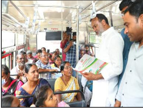
మహిళ చెప్పిన మాటతో బస్సులో ఒక్కసారిగా అందరూ నవ్వారు.. ఈ కార్యక్రమంలో మండల నాయకులు, కార్యకర్తలు తదితరులు పాల్గొన్నారు.