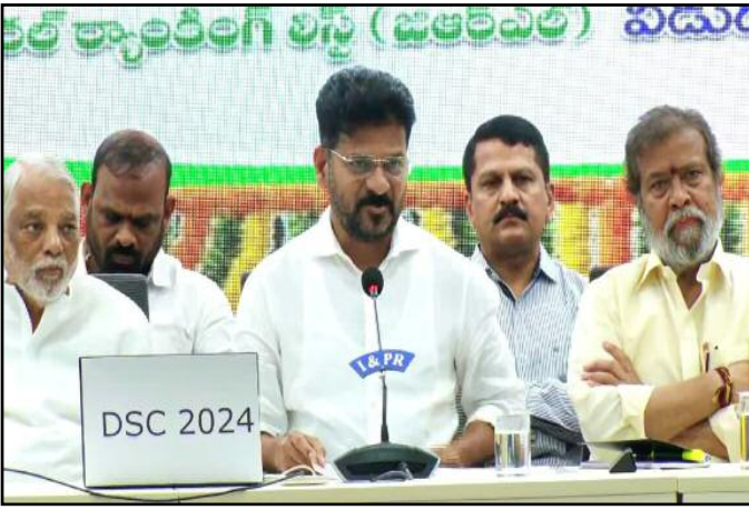
ఒకసారి మాత్రమే డీఎస్సీ నోటిఫికేషన్ ఇచ్చిందని ముఖ్యమంత్రి విమర్శించారు. గత పదేళ్ల కాలంలో 7,857 పోస్టులను మాత్రమే భర్తీ చేసిందన్నారు.

శాసనసభ / హైదరాబాద్ : దసరా లోపు కొత్త ఉపాధ్యాయ నియామక పత్రాలు అందిస్తామని తెలంగాణ ముఖ్యమంత్రి రేవంత్ రెడ్డి అన్నారు. “ఓ సచివాలయంలో కుర్చీలు అయిన డీఎస్సీ ఫలితాలను విడుదల చేశారు. 11,062 పోస్టుల భర్తీకి ఇలా 18 నుంచి ఆగస్ట్ 5వ తేదీ వరకు పరీక్షలు నిర్వహించారు. ఫలితాలు విడుదల చేసిన తర్వాత సీఎం మాట్లాడుతూ... దసరా నాటికి సర్టిఫికేట్ వెరిఫికేషన్ పూర్తి చేస్తామన్నారు. అక్టోబర్ 9న ఎల్పీ స్టేడియంలో నియామక ఉత్తర్వులు అందిస్తామన్నారు. గత బీఆర్ఎస్ ప్రభుత్వం పదేళ్లకు ఒకసారి మాత్రమే డీఎస్సీ నోటిఫికేషన్ ఇచ్చిందని ముఖ్యమంత్రి విమర్శించారు. గత పదేళ్ల కాలంలో 7,857 పోస్టులను మాత్రమే భర్తీ చేసిందన్నారు.