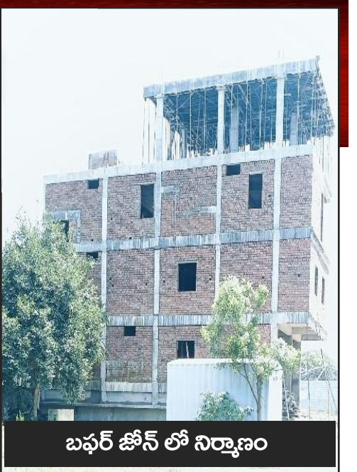
బఫర్ జోన్ లో నిర్మాణం

తుర్కయంజాల్ మున్సిపాలిటీ పరిధి శోభానగర్ లోని సర్వే నెంబర్ 475 పూర్తిగా ఎఫ్ఐఎల్ లో ఉంటుంది. అయితే సాగర్ రహదారికి కూతవేటు దూరంలో ఉండటం, రవాణా, రోడ్ల సౌకర్యం మెరుగ్గా ఉండటంతో ఈ ప్రాంతంలో నివాసం ఏర్పరుచుకునేందుకు ప్రజలు ఆసక్తి చూపుతున్నారు. అయితే ఈ సర్వే నెంబర్ ఎఫ్ఐఎల్ లో ఉంటుందన్న విషయం తెలియక చాలా మంది ప్లాట్లు కొనుగోలు చేశారు. అయితే సదరు ప్లాట్ల యజమానులు ఇప్పుడు లబోదిబోపంటున్నారు. ఎలాగైనా ఇక్కడ నిర్మించుకుంటే తమ ప్లాట్లు తమకు దక్కుతాయన్నా ఉద్దేశంతో తప్పుడు మార్గాలను అనుసరిస్తున్నట్లు తెలుస్తోంది. తుర్కయంజాల్ లోని కొందరు ఎల్ఐడీఎల్ విరికి తప్పుడు మార్గాన్ని చూపుతున్నారని గుసగుసలు వినిపిస్తున్నాయి. ఇరిగేషన్ శాఖ నుంచి తీసుకోవాల్సిన నో అబ్జెక్షన్ సర్టిఫికేట్ ను సకిలీది సృష్టించినట్లు పలువురు చెబుతున్నారు. బిల్డింగ్ పర్మిట్ సమయంలో ఈ ఎన్వోసీ సమర్పించాల్సి ఉంటుంది. ఓ సకిలీ సర్టిఫికేట్ సృష్టించి, దాన్ని మార్పింగ్ చేసి పదుల సంఖ్యలో ఇళ్లకు అదే ఎన్వోసీని జత చేసినట్లు స్థానికులు చెబుతున్నారు. ఇరిగేషన్ అధికారులు, మున్సిపల్ అధికారులు ఇప్పటికైనా ఇలాంటి తప్పుడు వ్యక్తుల పట్ల జాగ్రత్తలు తీసుకోవాలని పరిశీలకులు హెచ్చరిస్తున్నారు.