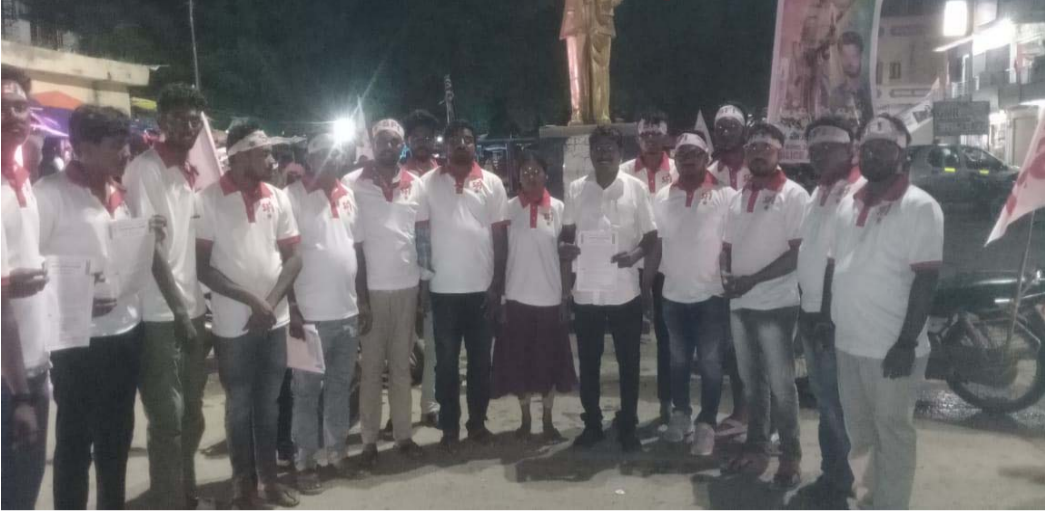
పెండింగ్ ఉన్న స్కాలర్ షిప్ ఫీజు రీయంబర్స్మెంట్ విడుదల చేయాలి.