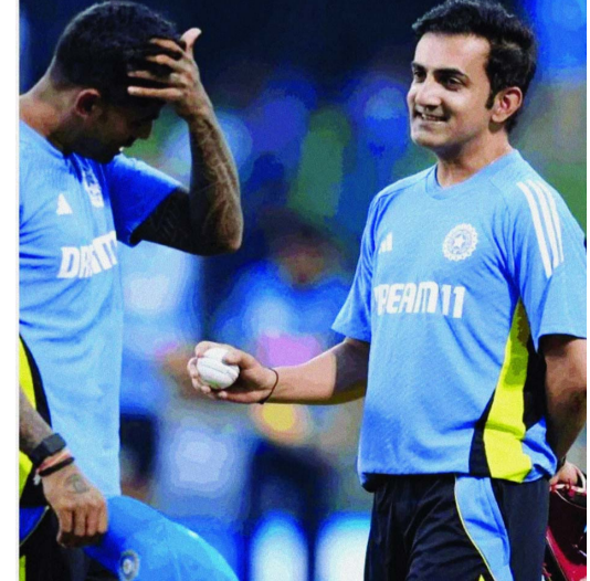
గంభీర్ మెంటార్ గా వ్యవహరించారు.. గత ఐపిఎల్ సీజన్లో కోల్ కతా జట్టుకు మెంటార్ గా బాధ్యతలు స్వీకరించిన

తొలి టోర్నీ కొంచెం తీపి, కొంచెం చేదు ఫలితాలను ఇవ్వడంతో గౌతమ్ గంభీర్ వ్యవహార శైలి మారుతుందని చాలామంది భావించారు. కొన్ని కొన్ని మీడియా సంస్థలు అదేవిధంగా వార్తలను ప్రసారం చేశాయి.. ఇక క్రిడా విశ్లేషకులు వ్యాఖ్యలు గురించైతే ప్రత్యేకంగా చెప్పాల్సిన అవసరం లేదు. అయితే గౌతమ్ గంభీర్ వ్యవహార శైలి పైన ఒకప్పటి స్టార్ ఫీల్డర్ జాంటీ రోడ్స్ స్వీచు విప్పారు.. " మైదానంలో ఆడే తీరు పట్ల గౌతమ్ గంభీర్ ఒక స్పష్టమైన వైఖరితో ఉంటాడు. ముఖ్యంగా అటగాళ్ల విషయంలో అత్యంత కఠినంగా ఉంటాడు. చివరి వరకు పోరాడాలనేది అతడి నైజం. అత్యుత్తమ ప్రదర్శన చేయాలని ప్రతి అటగాడిలో పోరాట స్ఫూర్తిని సూరిపోస్తూ ఉంటాడు.. ఏమాత్రం నిర్లక్ష్యం వహించినా ఉరుకోడు. ప్రతి అటగాడు నూటికి నూరు శాతం అద్భుతమైన ప్రదర్శన చేయాల్సిందేనని చెబుతుంటాడు. అదే దిశగా వారికి శిక్షణ ఇస్తూ ఉంటాడని" జాంటీ రోడ్స్ పేర్కొన్నారు. ఇండియన్ ప్రీమియర్ లీగ్ లో జాంటీ రోడ్స్, గౌతమ్ గంభీర్ లక్ష్మీ జట్టుకు సేవలందించారు.. రోడ్స్ ఫీల్డింగ్ కోసం గా పనిచేశాడు. గౌతమ్