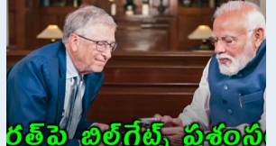
రకప బిల్ గేట్స్, పోషకాహార

దేశంలో పోషకాహార లోపం సమస్యను పరిష్కరించేందుకు భారత్ చేస్తున్న విశేష కృషిని మైక్రోసాఫ్ట్ సహ వ్యవస్థాపకుడు, దాతృత్వవాది బిల్ గేట్స్ ప్రశంసించారు. భారత్ చర్చలు చాలా ఆకట్టుకుంటున్నాయని, ఈ సమస్యను పారదోలేందుకు దృష్టిపెట్టినందుకు 'పి' రేటింగ్ ఇస్తున్నారని ఆయన అన్నారు. ఆదాయ స్థాయిని బట్టి పోషకాహార సూచీలలో ఆశించిన దానికంటే వెనుకబడి ఉన్నామని భారత్ ఒప్పుకుంటోందని, ఈ విధంగా నిజాన్ని అంగీకరించడం, సమస్య పరిష్కారంపై దృష్టి పెట్టడం ఆకట్టుకునే విషయాలని తాను భావిస్తున్నట్లు బిల్ గేట్స్ చెప్పారు. ఇతర దేశాల ప్రభుత్వాల కంటే భారత్ ఈ అంశంపై ఎక్కువ దృష్టి సారించిందని గేట్స్ మెచ్చుకున్నారు. మధ్యప్రదేశ్ భోజన విధానాలు, ప్రజా ఆహార విధానాల ద్వారా బలపరచడమే ఆహారాన్ని అందించేందుకు ప్రయత్నిస్తోందని ఆయన ప్రస్తావించారు. సమస్యను పరిష్కరించేందుకు భారత్కు ఇప్పటికీ గొప్ప అవకాశం ఉందని, భారత్ కు ఈ విషయంలో తాను 'పి' రేటింగ్ ఇవ్వడానికే ఇదే కారణమని పేర్కొన్నారు. గేట్స్ ఫౌండేషన్ 'గోల్డ్ కీపర్స్ రిపోర్ట్-2024' ప్రారంభించిన సందర్భంగా పీఠిక ఇచ్చిన ఇంటర్వ్యూలో ఒక ప్రశ్నకు ఈ సమాధానం ఇచ్చారు. విద్య విషయంలో భారత్ తనకు తాను 'బి' రేటింగ్ ఇస్తుంటుందేమోనని భావిస్తున్నారని బిల్ గేట్స్ అన్నారు. మరింత మెరుగ్గా రాజీనామాని నిజమైన ఉద్దేశం భారత్కు ఉందని ఆయన పేర్కొన్నారు.