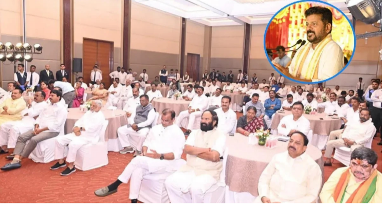
హైదరాబాద్ : కాంగ్రెస్ పార్టీలో రెడ్డి ఒక్కరే, అంతకుముందు కాసు బ్రహ్మానంద రెడ్డి ఇలా మాట బలమైన నాయకుడిగా నెగ్గించుకున్న నాయకులు వైఎస్ రాజశేఖర్ ఉండేవారని చెబుతారు.

తెలంగాణ సీఎం రేవంత్ రెడ్డి మాత్రం ఆ దిశగా అడుగులు సీఎం రేవంత్ సూచించిన నాయకుడి వైపు అధినాయకత్వం మొగ్గు చూపింది నామ లేదా మంగళవారాల్లో కొత్త అధ్యక్షుడిని ప్రకటిస్తారని పేర్కొంటున్నారు