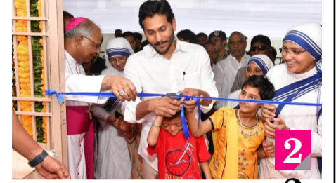
అమరావతి: ధర్మ, వాత్సల్యానికి మారుపేరుగా నిలిచిన మదర్ థెరిసా జయంతి నేడు. ఈ సందర్భంగా ఆ మహిళా యురాలికి మన స్ఫూర్తిగా విగతా..2లో