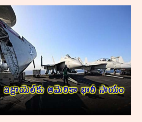
ఇజ్రాయెల్ కు అమెరికా భారీ సాయం

పశ్చిమాసియాలో యుద్ధమేఘాలు కమ్ముకున్న వేళ తాజాగా అమెరికా కీలక నిర్ణయం తీసుకుంది. ఇజ్రాయెల్ కు 20 బిలియన్ల దాదాపు విలువైన ఆయుధ విక్రయాల ఒప్పందానికి అమెరికా ఆమోదం తెలిపింది. అందులో అనేక ఫైలర్ జెట్లు, 50 పైగా ఎఫ్-15 ఫైలర్ జెట్లు, అధునాతన ఎయర్-టు-ఎయర్ క్షిపణులు, 120 ఎంఎం ట్యాంక్ మందుగుండు సామగ్రి, అధిక పేలుడు మోర్టార్లు ఉన్నాయి. ఈ మేరకు అమెరికా విదేశాంగ శాఖ ప్రకటన విడుదల చేసింది. అయితే, ఈ ఆయుధాలన్నీ ఎప్పుడు ఇజ్రాయెల్ కు చేరుకుంటాయనేది తెలియలేదు. వీటన్నింటినీ ఇజ్రాయెల్ కు అప్పగించడానికి కొన్నేళ్లు పట్టనున్నట్లు సమాచారం. అమెరికా ఇప్పటికీ ఈ ఆయుధాలు ఇజ్రాయెల్ సైనిక సామర్థ్యాన్ని దీర్ఘకాలికంగా పెంచుకోవడానికి సాయపడనుంది. కాగా, ఇజ్రాయెల్ పై ప్రతీకార కాండక్త రగిలిపోతున్న ఇరాన్, దానికి సిద్ధమైనట్లు వార్తలు వచ్చాయి. ఈ నేపథ్యంలో ఇజ్రాయెల్ ఆయుధ విక్రయ ఒప్పందానికి యూఎస్ ఆమోదించడం గమనార్హం.