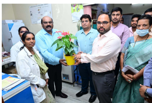
వ్యాధులు సాకాకుండా తీసుకోవలసిన జాగ్రత్తల పై ప్రజలకు అవగాహన కల్పించాలని వైద్య అధికారులను ఆదేశించారు. ప్రాథమిక ఆరోగ్య కేంద్రంలోని రోగులతో ముచ్చటించారు.