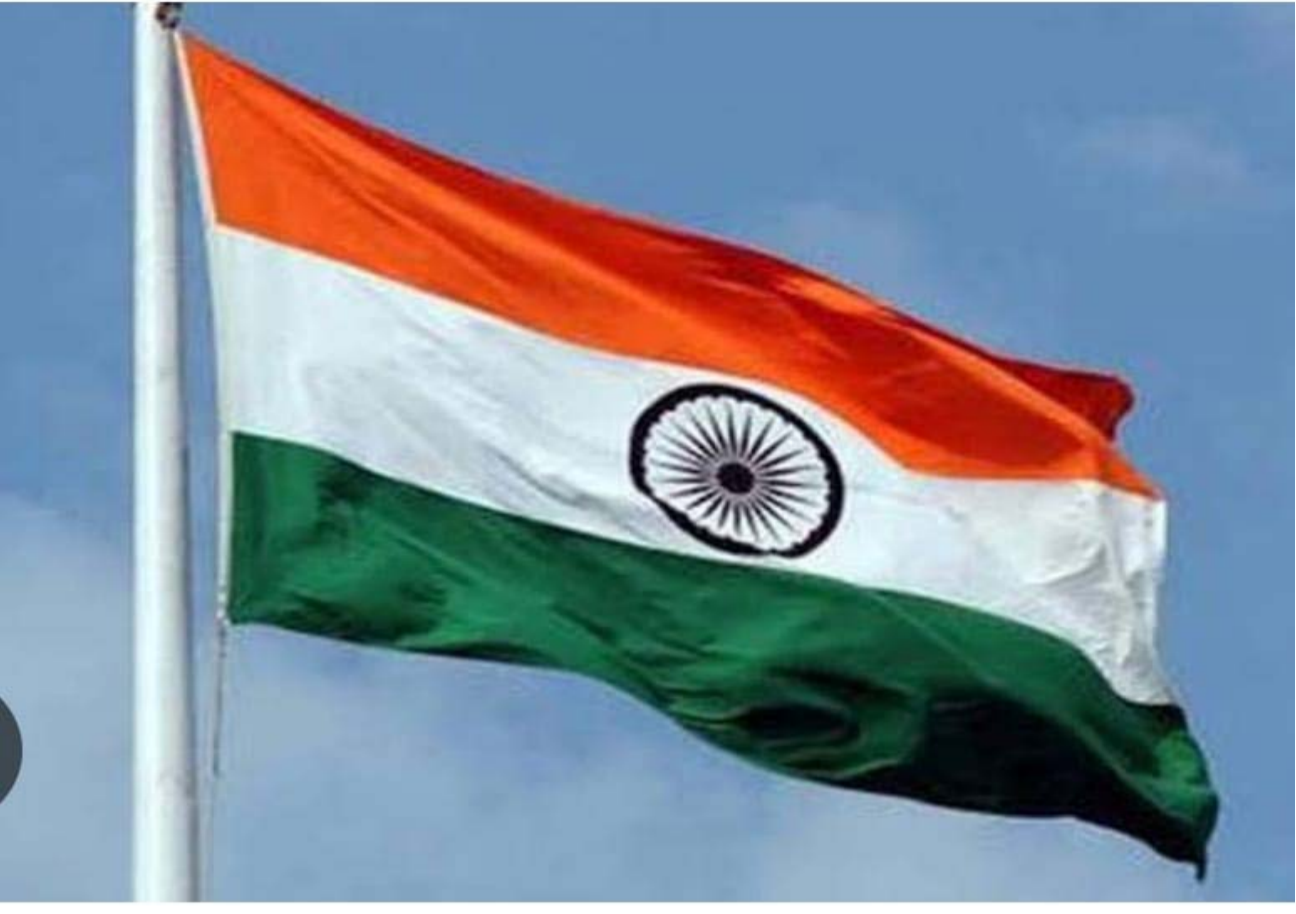
లేబర్ పార్టీ అధికారంలోకి వచ్చింది. వీరు ఇచ్చిన హామీలలో భారతదేశానికి స్వతంత్రం ఇవ్వాలనే హామీ కూడా ఉందని, అయితే అది ఎప్పుడు ఏ సమయంలో ఇస్తారని చెప్పకపోవడంతో.. మరో రెండు సంవత్సరాల పాటు వాయిదా పడింది. అలా చివరికి 1947

చింతపల్లి ఆగస్టు 14, శాసనసభ స్పీకర్ ప్రతినిధి: బ్రిటిష్ పరిపాలన నుంచి భారతదేశానికి స్వాతంత్ర్యం వచ్చేందుకు జరిగిన అనేకమైన పోరాటాల్లో ఎందరో దేశభక్తులు పాల్గొన్నారు. ప్రపంచ రాజకీయాల నేపథ్యంలోనూ, భారతీయ స్వాతంత్ర్య పోరాటాల ఫలంగానూ దేశానికి 1947 ఆగస్టు 14న అర్ధరాత్రే స్వాతంత్ర్యం వచ్చింది ఎందుకు మన దేశానికి అర్ధరాత్రే స్వాతంత్ర్యం ప్రకటించారు..? ఎవరైనా ఆలోచించారా..? భారత దేశానికి స్వతంత్రం తెచ్చిన మహానుభావులు ఎందరో వీరిలో కొంతమంది అహింస విధానాన్ని ఎంచుకోగా.. మరికొందరు హింస విధానాన్ని ఎంచుకున్నారు. యువకుల దగ్గర నుంచి మొదలు వృద్ధుల వరకు స్వతంత్ర దేశం కోసం పోరాడిన వారే. 1857 సిపాయిల తిరుగుబాటు మొదలు 1947 ఆగస్టు 15 వరకు మరెందరో త్యాగ ఫలితమే.. స్వాతంత్ర్యాన్ని తెచ్చిపెట్టింది. భారతదేశానికి స్వాతంత్ర దినోత్సవం ఎప్పుడు వచ్చింది అంటే.. ప్రతి ఒక్కరూ ఆగస్టు 15 వ తేదీ అర్ధరాత్రి 12 గంటల సమయంలో వచ్చిందని చెబుతారు. ఇక నిజానికి అర్ధరాత్రి స్వాతంత్ర దినోత్సవం ప్రకటించడం వెనుక ఆంతర్యం ఏమిటో ఇప్పుడు చూద్దాం. ఆగస్టు 15వ తేదీన అర్ధరాత్రి 12 గంటల సమయంలో స్వాతంత్ర దినోత్సవం ఇవ్వడానికి ముఖ్య కారణం ఏమిటంటే.. 1939 నుండి 1945 వరకు రెండవ ప్రపంచ యుద్ధం జరిగింది. 1942 వ సంవత్సరం లోనే భారతదేశానికి స్వతంత్రం ఇవ్వాలి ఉంది. కానీ రెండవ ప్రపంచ యుద్ధం ఇంకా ముగియకపోవడం వల్ల రెండవ ప్రపంచ యుద్ధం ముగిసిన వెంటనే స్వాతంత్రం ప్రకటించాలి అనుకున్నారు. ఇక ఈ సమయంలోనే బ్రిటన్ లో ఎన్నికలు జరుగుతున్నాయి. ఆ ఎన్నికల్లో